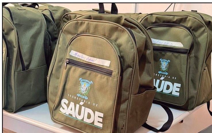
Os kits trazem conforto e segurança para os agentes

Segundo a administração municipal, a iniciativa faz parte do compromisso de valorizar e apoiar os agentes, que desempenham um papel fundamental na promoção da saúde preventiva e no acompanhamento das famílias da ci-