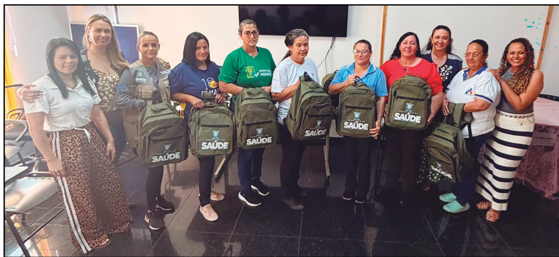
Os agentes receberam kits com camiseta, colete, chapéu, mochila, protetor solar e EPIs

dade. “Investir na segurança e no conforto dos nossos agentes é garantir que cada morador receba atendimento com cuidado e excelência”, afirmou a Prefeitura.