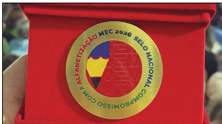
O Selo recebido pela Prefeitura de Silvânia

O CNCA não propõe uma resposta única ou centralizada para todo o país. Cada estado, em colaboração com seus municípios, elaborará sua política de alfabetização do território, de acordo com as suas especificidades.