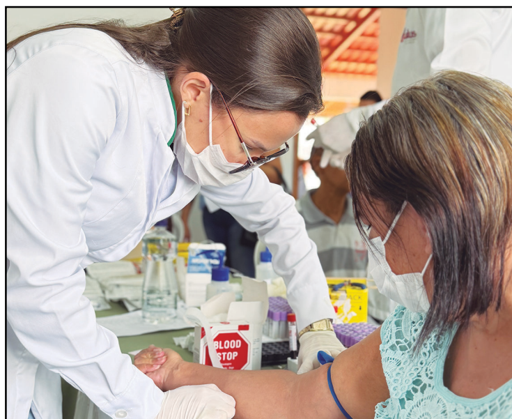
O Campo Saúde realizou mais de 2 mil atendimentos

A iniciativa é promovida pelo Sistema FAEG/SENAR e pelo Sindicato Rural, com a participação da Prefeitura Municipal de Silvânia e instituições apoiadoras. A ação demonstra que, quando se trabalha em parceria, é possível ampliar o aces-