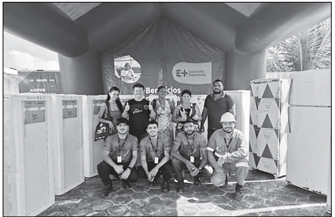
Diversos serviços gratuitos foram oferecidos para a população.

Para participar do sorteio, era necessário ser titular da conta de energia ou comprovar residência no endereço cadastrado, estar inscrito na Tarifa Social ou apresentar a folha-resumo do CadÚnico, possuir conta de energia