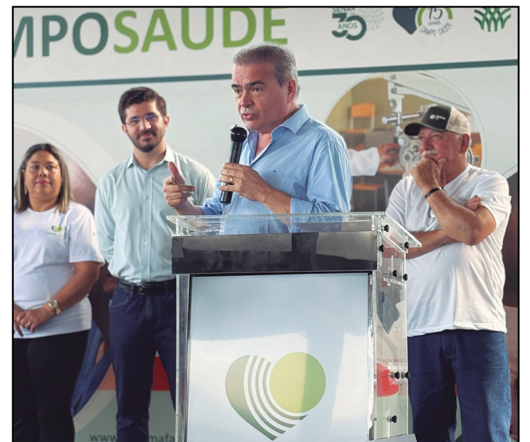
O prefeito reafirmou o compromisso da Prefeitura com qualidade e cuidado