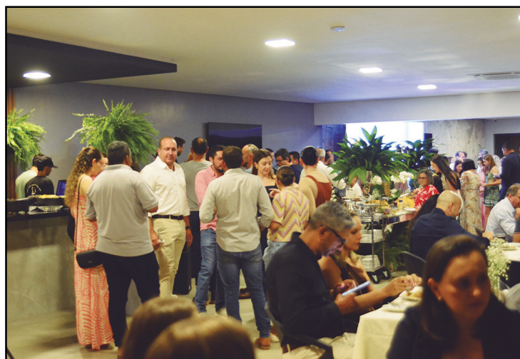
Muita gente compareceu à inauguração