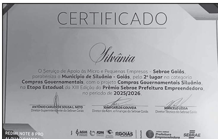
O certificado ganho por Silvânia - 2º lugar no Estado