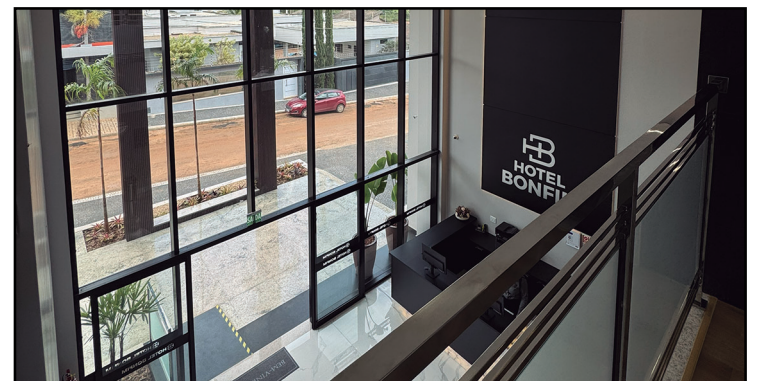
... e espaços amplos para grandes eventos