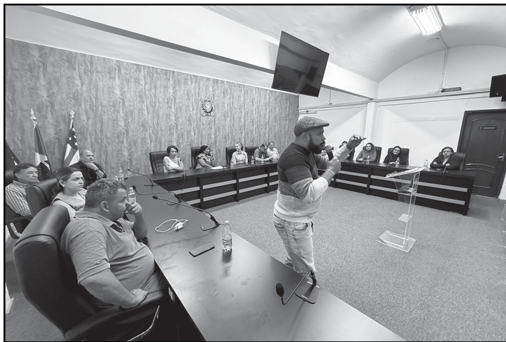
Projeto Corte do Bem foi apresentado durante solenidade na Câmara

ticiparam e contribuíram para este momento especial, reafirmando seu compromisso de continuar promovendo iniciativas que levem cuidado, dignidade e solidariedade à comunidade silvaniense.