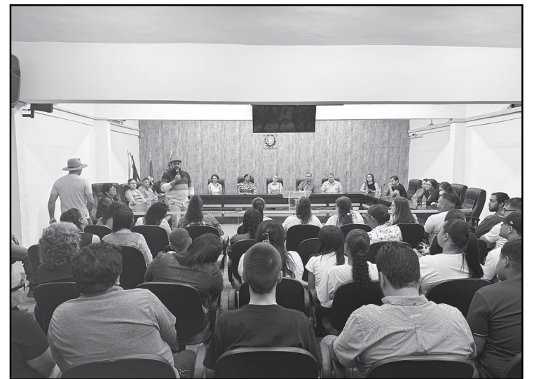
Várias pessoas da comunidade acompanharam a apresentação

A iniciativa contou ainda com o importante apoio do