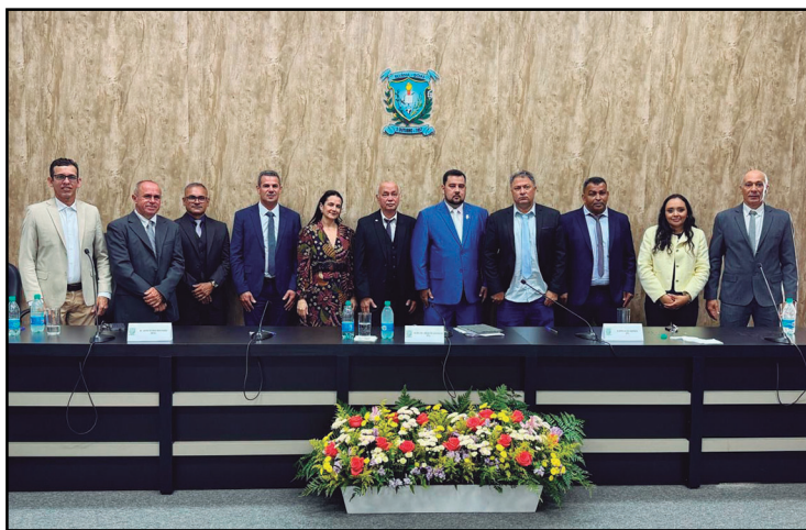
Os kits foram adquiridos com recursos devolvidos ao Executivo

A ação reforça o compromisso do Legislativo com a educação e o bem-estar dos