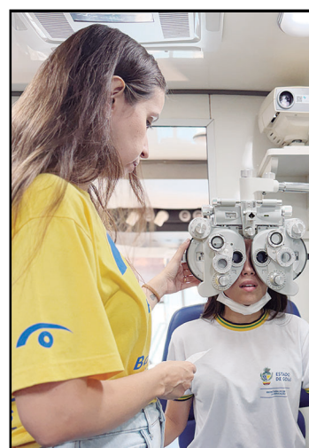
477 pessoas atendidas

477 pessoas com cuidados essenciais para prevenção e qualidade de vida.