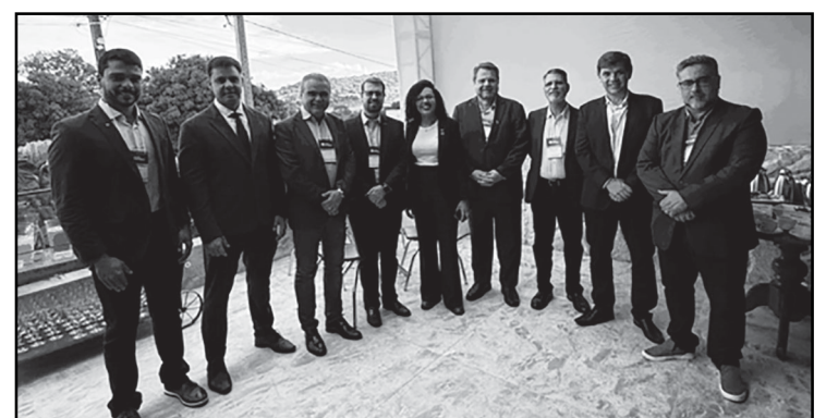
Diversas autoridades locais e do Estado estiveram no evento