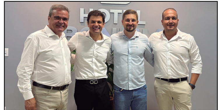
Os sócios do Hotel Bonfim ao lado do deputado estadual Issy Quinan