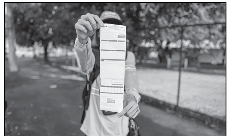
Nova conta de luz: informações mais claras