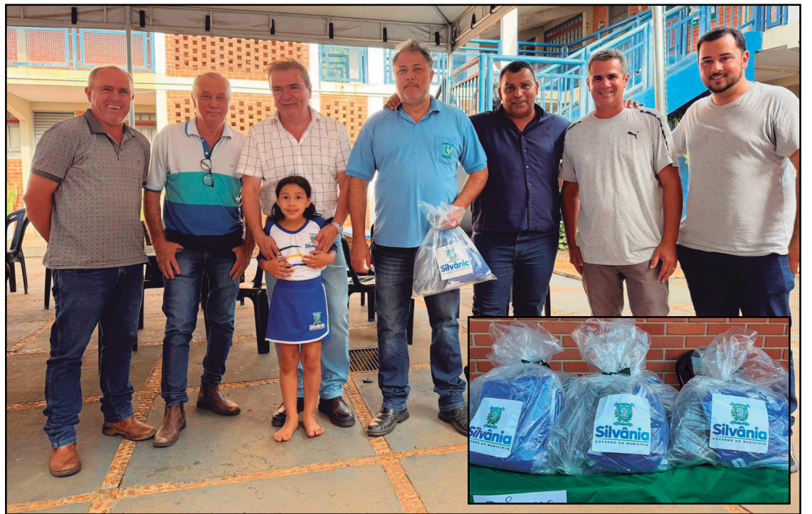
A entrega dos kits teve a presença de vereadores e o prefeito

estudantes, contribuindo para melhores condições de aprendizagem e promovendo mais