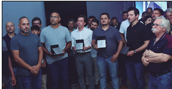
Profissionais que trabalharam no hotel foram homenageados