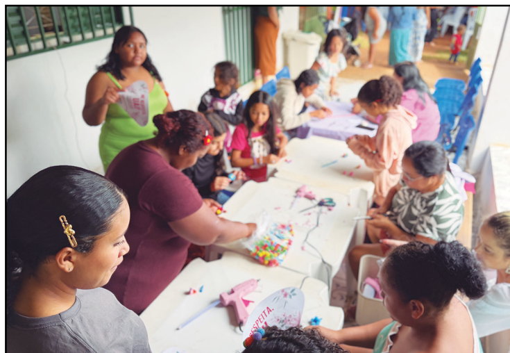
A programação foi bem diversificada

valorização feminina, ampliando espaços de participação e fortalecendo a rede de apoio às mulheres no município.