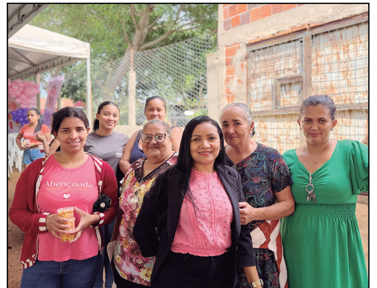
Mulheres do setor Daiana participaram das comemorações

A iniciativa reafirma a importância de políticas públicas e eventos que incentivem a