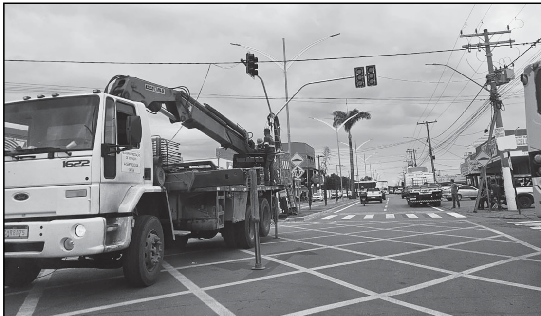
Um dos pontos a receber semáforo é o cruzamento em frente o Arroz Ligeiro

A Avenida Dom Bosco é a principal via de Silvânia, ligando o trevo de entrada ao centro da cidade. Além de concentrar grande fluxo de veículos, a avenida abriga comércios, escolas e o hospital municipal, sendo também um importante corredor para o escoamento da produção local.