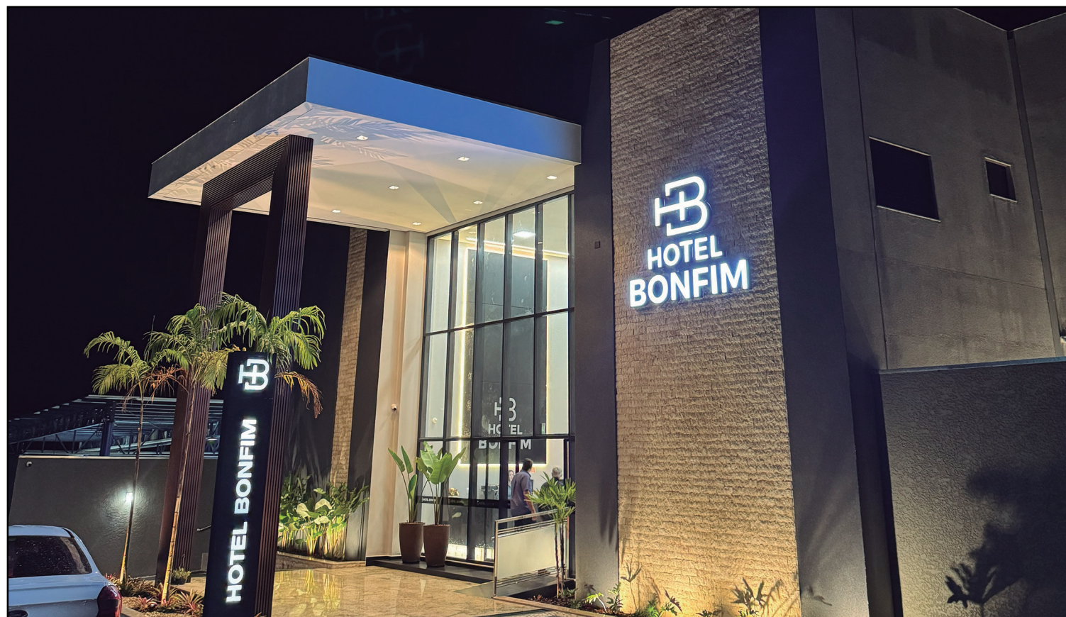
A fachada do novo empreendimento: sofisticação e conforto a preços acessíveis

or impacto da noite foi a exibição do vídeo institucional de lançamento do Hotel Bonfim, produzido com exclusividade para a ocasião e apresentado pela primeira vez ao público naquela noite. Com imagens que percorreram a trajetória do projeto, desde a concepção até a entrega, e narração que traduz a essência da Experiência Bonfim, o vídeo provocou uma emoção genuína na