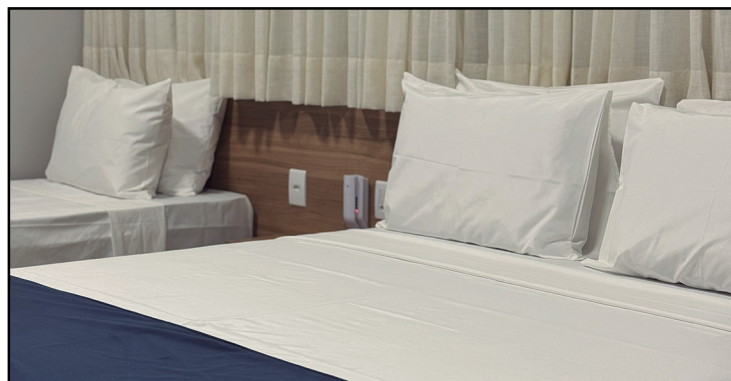
Hotel Bonfim: apartamentos modernos, salas de reunião equipadas, ...