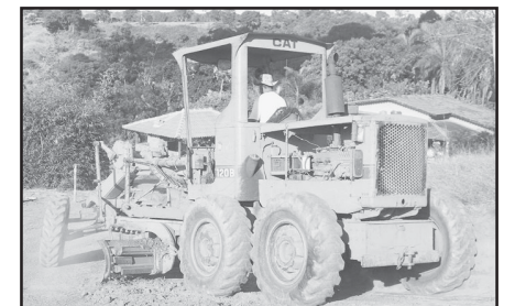
Patrolamento de estradas.

A Prefeitura de Silvânia / Secretaria de Agricultura através do departamento de Desenvolvimento Rural vem desempenhando um bom trabalho de recuperação da estradas de nosso município, desta feita a região do Cruzeiro do Bom Jardim conta hoje com todas as estradas patroladas e com previsão de cascalhamento nos pontos críticos no período das chuvas, a prevenção se faz necessária e o departamento de Desenvolvimento Rural sabe disso e não perde tempo e desempenha seu papel com rapidez e qualidade, como sabemos o Muni-