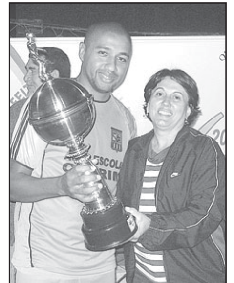
Prefeita entrega troféu na final da Taça Cidade de Silvânia.

No dia 12 de julho teve inicio o Campeonato de Futebol Society com 10 equipes participantes.