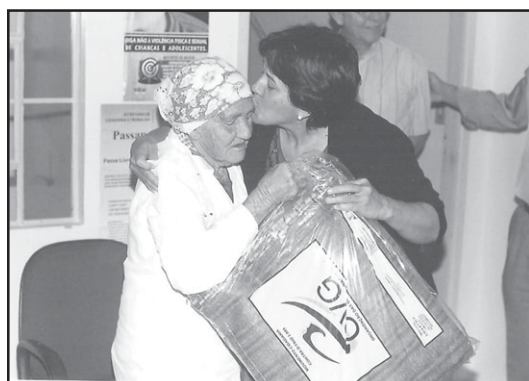
Prefeitura, em parceria com a OVG, faz entrega de cobertores para as famílias carentes de Silvânia.

Quando da distribuição dos tiquetes, antes de recebê-los as famílias foram visitadas pela equipe da Secretaria de Ações Sociais. A distribuição de cobertores no meio rural foi realizada através dos agentes comunitários de saúde.