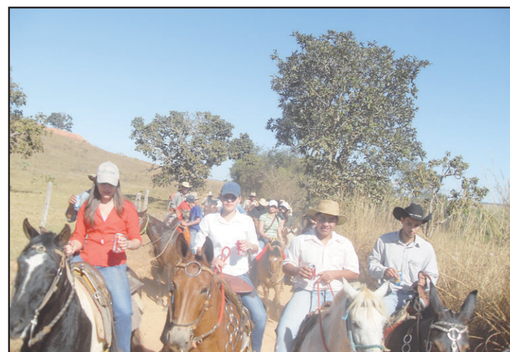
Cavalgada dá início às atividades da Semana Cultural.

A Semana Cultural foi encerrada com uma demonstração de “fê, trabalho e cultura” por parte dos moradores daquela região.