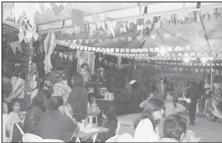
Equipe que coordena os trabalhos de reforma da Igreja Matriz de Nossa Senhora do Rosário, em Silvânia, promoveram Festa Junina no início de julho para arrecadar mais recursos financeiros para custear as obras. A Festa foi bastante organizada e contou com um bom público presente. Parabéns aos organizadores pela brilhante iniciativa.