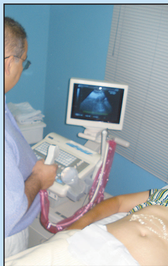
Realização de exames.

O Hospital Nosso Senhor do Bonfim conta com amplo quadro de profissionais tais como Ginecologista, Obstetra, Cardiologista, Pediatra, Ortopedista, Clínicos Gerais, Anestesiista e Cirurgião Geral para garantir mais qualidade de vida aos cidadãos Silvanienses, com um índice de atendimento de mais de 21 mil consultas desde janeiro de 2009.