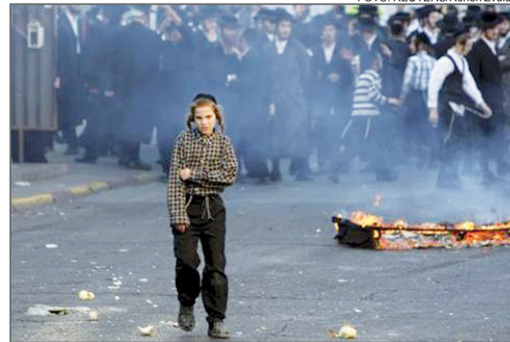
Cena de um dos conflitos que tomaram as ruas do Mea Shearim nos últimos dias.