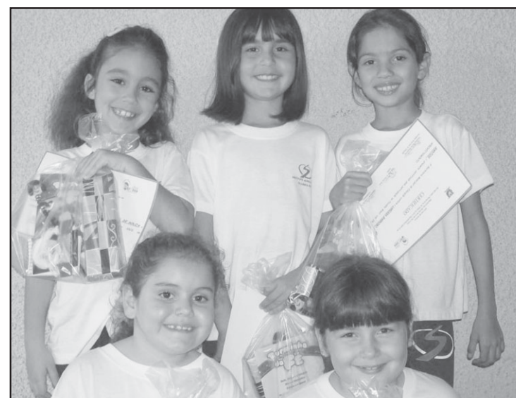
Crianças da rede municipal participam da Provinha Brasil 2009.