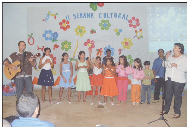
Adultos e crianças participam da II Semana Cultural.

Conselho Municipal de Cultura Silvânia-GO