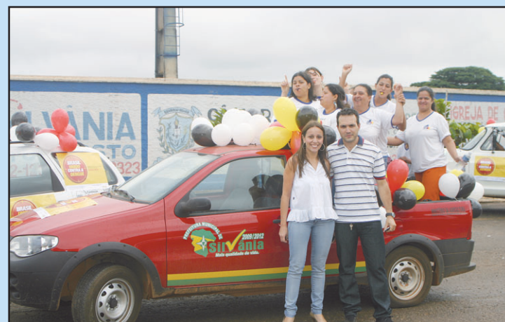
Equipe da Secretaria de Saúde durante o Mutirão.

Durante a campanha foram visitadas 5.465 residências. A campanha também se estendeu às Escolas, onde aconteceu de 16/05 a 16/06. As escolas mobilizaram seus alunos para a coleta seletiva de lixo