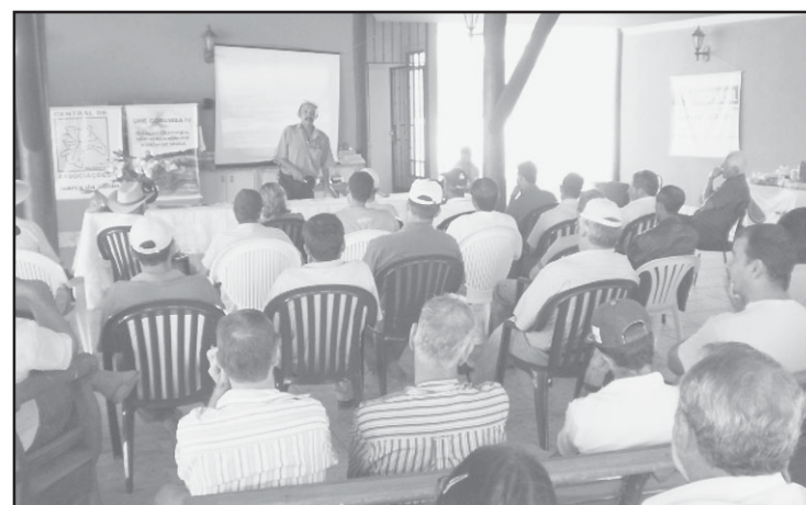
Palestra para motivação e apresentação dos objetivos do projeto.