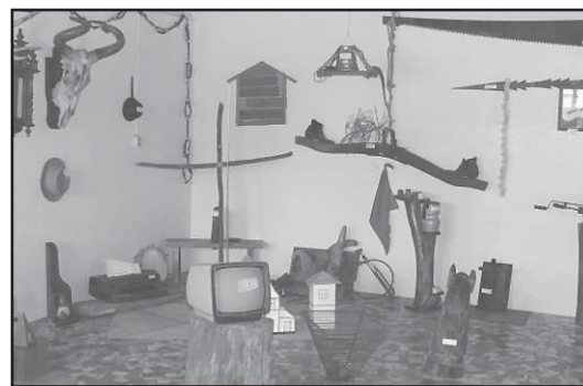
Acervo Cultural: objetos ligados ao nosso passado.

Manter esse Acervo Cultural significa entregar a essa geração marcada pela tecnologia, um passado vivo, de relações interpessoais saudáveis, de uma história vivida com dificuldade, mas de mui-