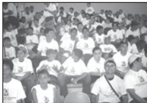
Crianças assistem Futsal em Goiânia.

laboração dos professores da escolinha do Atlético e de alguns pais que nos ajudaram. No intervalo de um jugo para outro a Agencia Goiana de Esporte e Lazer - AGEL patrocinou lanche e camisetas a todas as crianças e acompanhantes. A viagem foi tranquila e as expectativas foram todas atingidas, as crianças contaram com a companhia