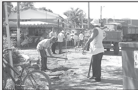
Construção de valeta na Av. Mário Ferreira.

Neste mês de março, também, foram realizadas várias outras ações, entre elas podemos citar: troca de lâmpadas de iluminação pública; pintura de meios-fios; retirada de entulhos das calçadas e lotes baldios; aplicação de secante no combatendo aos matagais; patrolamento e encascalhamento dos Bairros Maria de Lourdes e Santo Antônio; patrolamento de to-