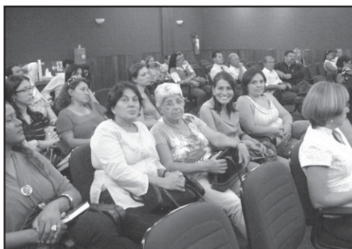
Convênio beneficiará gestores sociais.

Para Silvânia foram cedidas dez vagas. O curso que será gratuito para o município, teve início no dia 27 de março,