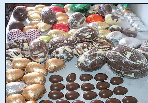
Companhia Art & Chocolate.

Lá você poderá encontrar ovos de todos os tamanhos a partir de noventa centavos. Visite, comprove e faça a encomenda. Se preferir ligue 3332-1432, ramal 224. Fazendo