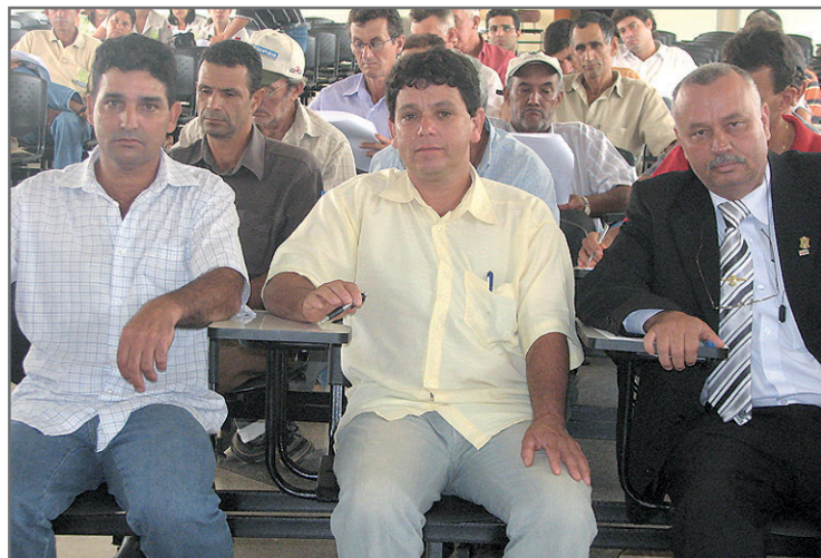
Presidente da Câmara prestigia a posse dos novos dirigentes da Coopersil.