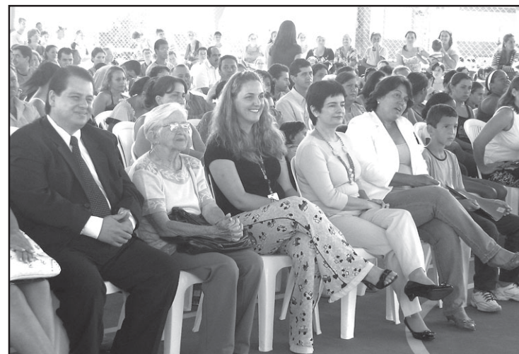
Diversas autoridades prestigiaram a inauguração da quadra.

A quadra coberta do Aprendizado Marista Padre Lancísio é uma obra que veio para garantir mais qualidade no ensino das crianças e também mais conforto para alunos e funcionários. Será de