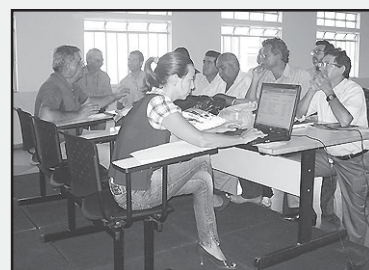
Conselheiros acompanham a votação dos projetos territoriais.

As instâncias diretivas do Conselho Territorial de Desenvolvimento Rural Sustentável e Solidário – CTDRS se reuniram no dia 11 de março último no auditório da UBEC-CENTAF para analisar os projetos de investimentos apresentados pelos municípios integrantes do Território Rural Estrada de Ferro a serem financiados pelo Governo Federal através do Ministério do Desenvolvimento Agrário - MDA. Os recursos e projetos são dedicados exclusivamente à promoção e fortalecimento da agricultura familiar e dos sujeitos sociais do campo e serão ainda votados pela assembléia geral.