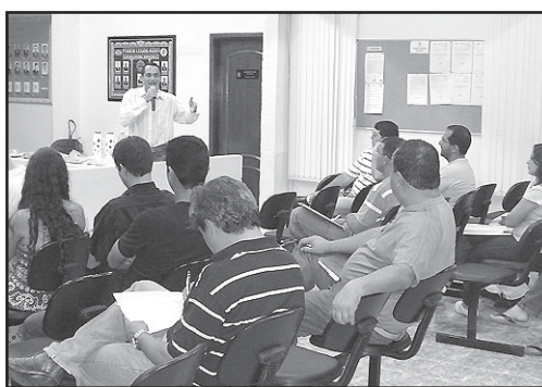
Palestra realizada no auditório da Câmara.

pósito, função e estrutura do Sistema Confea/Crea; importância do profissional habilitado para a sociedade; atribuições e honorários profissionais; e código de ética. Com o tema "Preenchimento de ART", a palestra vai abordar a lei nº 6.496/77 que dispõe sobre a criação da ART e da Mútua; além de orientar o uso do programa ART Web e prestar esclarecimentos sobre taxas e códigos de atividades, entre outros. O último tema será sobre a "Implantação da ISO 9001 no Crea de Goiás". A proposta é explicar para os profissionais como funciona a política da qualidade; o escopo da certificação, os tipos de documentos e a constante busca do Crea-GO pela eficácia no sistema da qualidade.