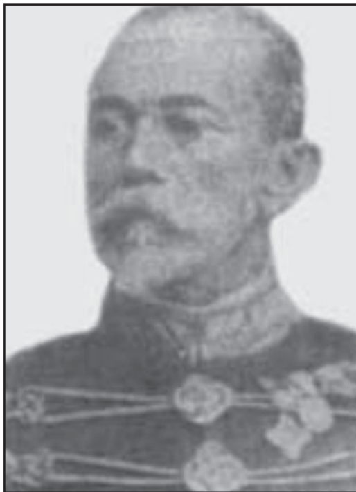
Marechal Brás Abrantes, silvaniense que governou Goiás de 1891 a 1892.

Quando o Brasil declara guerra ao Paraguai, Brás Abrantes foi lutar na Batalha dos Campos Avai permanecendo lá por três anos. Esta batalha foi travada em território paraguaio, em dezembro de 1868. A força paraguaia foi derrotada sob o comando do Marquês de Caxias. O pintor Pedro Américo registrou este episódio em sua tela intitulada "Batalha do Avai" que se encontra no Museu Nacional de Belas Artes no Rio de Janeiro.