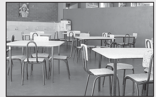
Dia 02 de março foram iniciadas as atividades da Creche Maria Tereza que passou recentemente por uma reforma de emergência.

A Secretaria de Educação de Silvânia informa que estão à disposição, vários certificados dos Cursos de Informática, realizados nos anos de 2003, 2004, 2005,