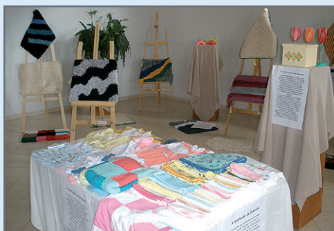
Enxovais e tapetes produzidos na entidade.

Os tapetes e o artesanato são produzidos por adolescentes que frequentam atividades desenvolvidas no anexo da Fraternidade que fica no bairro São Sebastião, aos sábados, e os enxovais são confeccionados por voluntárias que participam de trabalho assistencial às quartas-feiras, à tarde, na sede do Centro. Esses