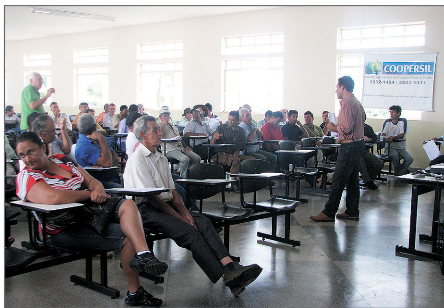
Inúmeros produtores rurais participaram da Assembléia Geral da Coopersil.