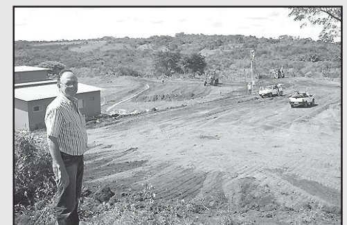
Segue em ritmo acelerado a construção do abatedouro de frango que em breve gerará vários empregos para Silvânia.