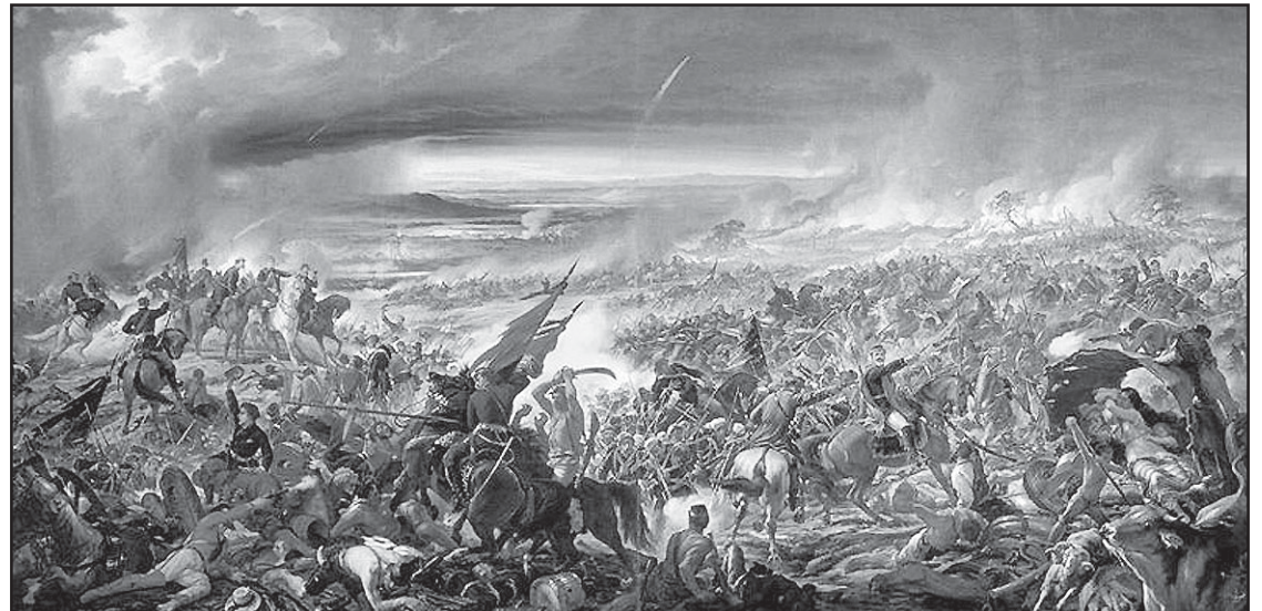
Batalha do Avaí, 1872/77, óleo sobre tela, 600x1100cm, de Pedro Américo, acervo do Museu Nacional de Belas Artes. Representa o episódio da Guerra do Paraguai no qual Brás Abrantes participou.

Em 1891 o coronel Constâncio Ribeiro da Maia assumiu a presidência do Estado, mas com a renúncia do presidente da República Deodoro da Fonseca, Constâncio percebeu que não tinha autoridade suficiente para conter os ataques dos Bulhões, grupo político de