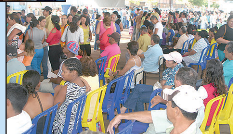
1ª Grande Ação Integrada de Saúde da Silvânia.

tindo o diagnóstico de problemas mais graves.