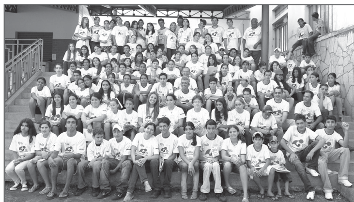
Dezanas de jovens de Silvânia e região participaram do RYLA.

estudantes das escolas de Silvânia, Gameleira de Goiás e Anápolis. As escolas de Silvânia participantes foram: Instituto Auxiliadora, Ginásio Anchieta, Moisés Santana e Dom Emanuel. Além das importantes palestras, esses alunos receberam café da manhã, lanches e um caprichado almoço. E puderam conferir apresentação de peça de tea-