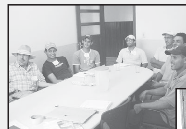
Participantes do Curso de Inseminação Artificial.

O Serviço Nacional de Aprendizagem Rural – SENAR/GO e o Sindicato Rural de Silvânia promoveram na UBEC-CENTAF, de 09 a 13 de março último, o curso de Inseminação Artificial deman-