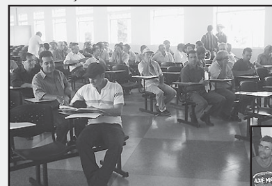
Cooperados aguardando início dos trabalhos da Assembléia.

A COOPERSIL e Central de Associações realizaram no au-