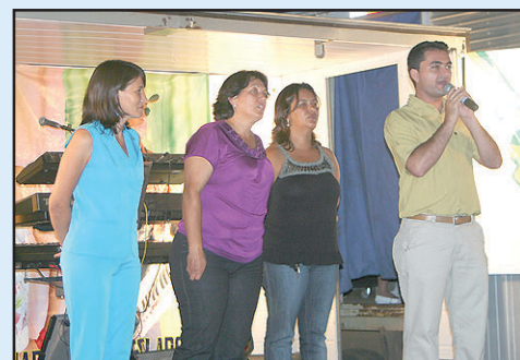
Evento em homenagem ao Dia da Mulher.

Com repertório eclético, cantou MPB, forró e axé music agradando a todos que estiveram presentes no evento. Para completar a comemoração do Dia Internacional das Mulheres, no