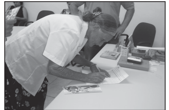
Uma das beneficiárias com o cheque moradia

Em pouco tempo a Prefeitura providenciou a construção dos alicerces, que é a contrapartida que precisa dar e os beneficiários