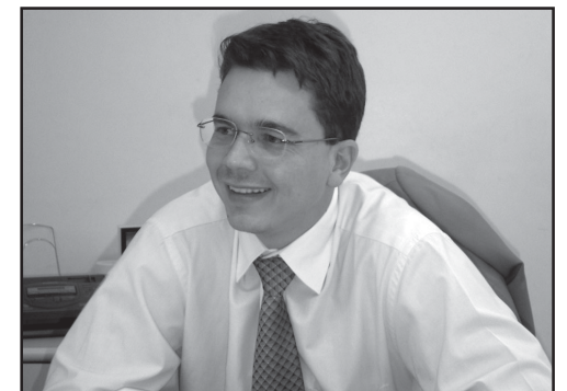
Dr. Carlos Luiz W. de Pina, novo Promotor.

Ele se coloca à disposição da população pelo telefone 3332-1676, ou pessoalmente no Fórum, de segunda a sexta-feira, preferencialmente à tarde, no horário das 14 às 16h.