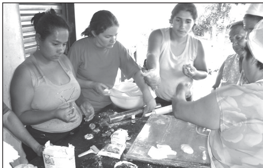
O curso de tortas foi um dos que fizeram mais sucesso.

Este curso foi mais um dentre os inúmeros que estão sendo promovidos pela Secretaria de Assistência Social. A intenção da Primeira Dama é proporcionar a toda a população