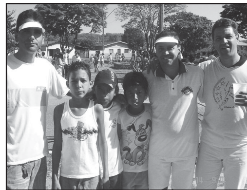
A equipe do P.E.A.B.: cidadania.