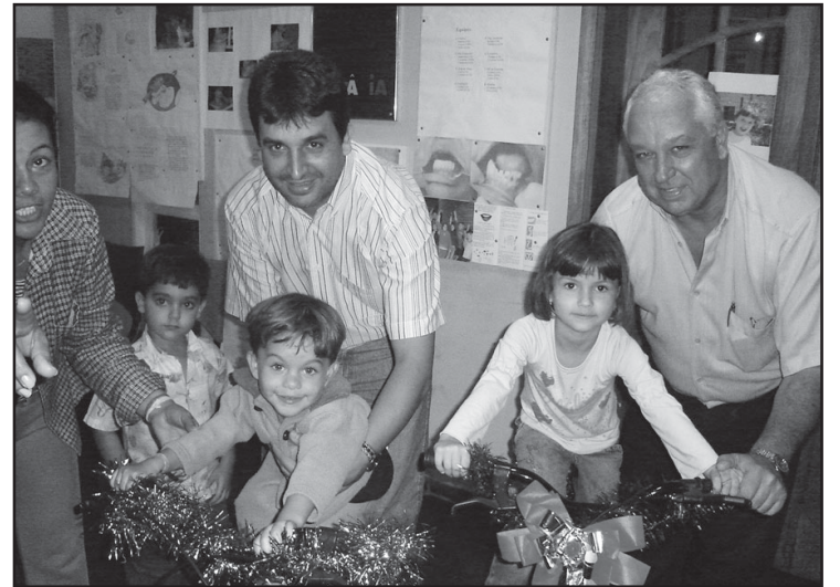
O prefeito entregando prêmios aos vencedores.