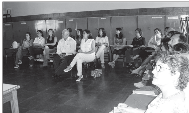
Reunião no Aprendizado com representantes da Unilever.

A Unilever prosseguirá em 2007 com o projeto Infância Protegida em Silvânia e mais quatro municípios goianos. O anúncio foi feito em reuniões de trabalho com os prefeitos, as primeiras damas e equipes ligadas ao projeto nos municípios beneficiados que aconteceram nos municípios em outubro.