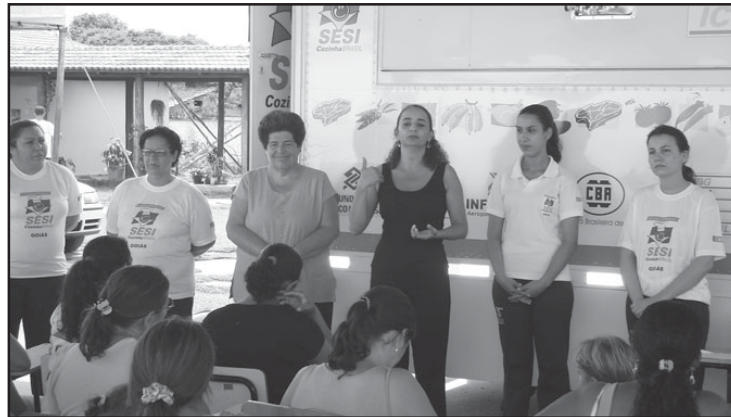
Cozinha Brasil: ensinando a aproveitar melhor os alimentos.

Quatro funcionárias do Sesi, duas nutricionistas e duas auxiliares de cozinha, estiveram ministrando o curso do