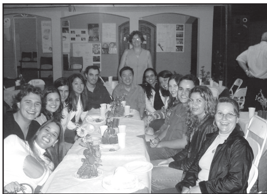
Equipe de odontologia na entrega do prêmio.