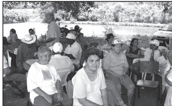
A Semana do Idoso: alegria e descontração.

Como a maioria dos idosos da zona rural não puderam comparecer aos festejos, houve