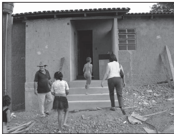
Uma das casas entregues pela Primeira Dama.