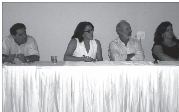
A Primeira Dama Célia em reunião com equipe da Unilever.