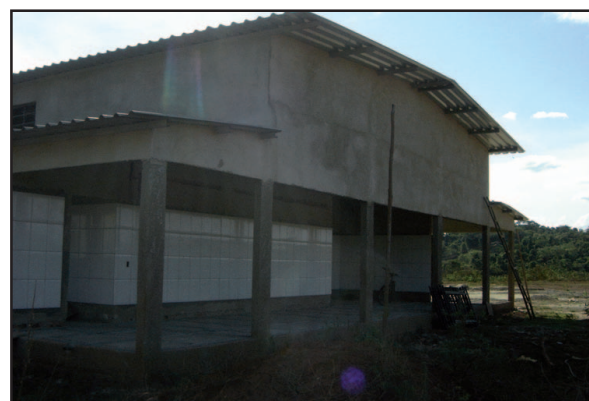
A obra de construção do abatedouro de frango...

ga das máquinas e equipamentos necessários ao funcionamento do abatedouro, os quais deverão ser instalados logo após o término da construção do prédio que os abrigará.