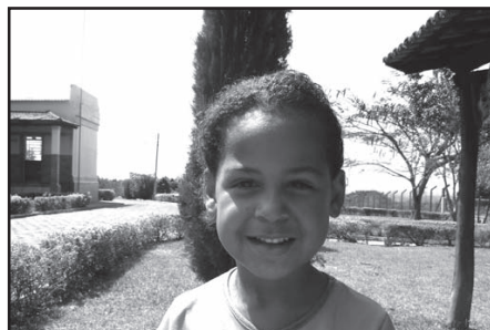
Estes são alguns dos...

Além da prevenção, são realizados também procedimentos curativos que se constituem de restaurações, exodontias, raspagens e profilaxia.