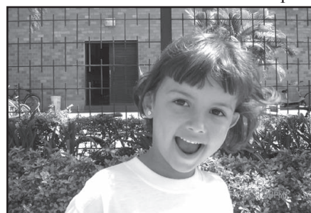
... Garoto/Garota Sorriso.

to de Odontologia Social da Universidade Estadual de Campinas, UNICAMP, interior de São Paulo, o Centro de Saúde Bucal da prefeitura de Silvânia resolveu instalar, em sua primeira edição, a Semana da Odontologia, de 23 a 27 de outubro, a fim de que a população silvaniense tenha a oportunidade de melhor se informar sobre o que a odontologia de Silvânia está fazendo pela sua população, os números de atendimentos em consultório para realização de ações curativas como remoção de cáries e de indutos de cálculos gengivais (tártaros), extrações, dentre outros procedimentos, e, principalmente, as ações preventivas como palestras, orientações de promoção de saúde bucal realizadas em escolas, bairros e comunidades rurais, além das atividades de aplicação tópica de flúor realizadas em todas as escolas