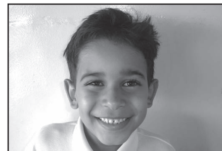
... candidatos ao título de...

Um casal de crianças, entre 3 e 7 anos, que apresentava bom cuidado com seus dentes foi escolhido em cada escola representando o garoto e a garota com o sorriso mais bonito. Cada criança escolhida foi fotografada e sua foto anexada em um mural na Secretaria Municipal de Saúde para que o Conselho