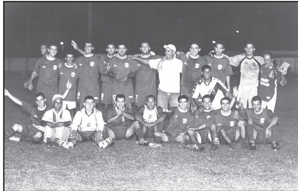
Aprendizado: oitavo título municipal.

O técnico, que tinha sua primeira experiência nessa função, foi decisivo na arran-