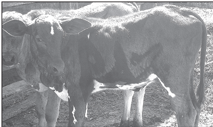
A bezerra silvaniense: mensagem para o mundo.