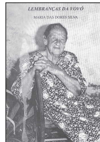
Lembranças da Vovó: "poesia simples como o arco-íris."