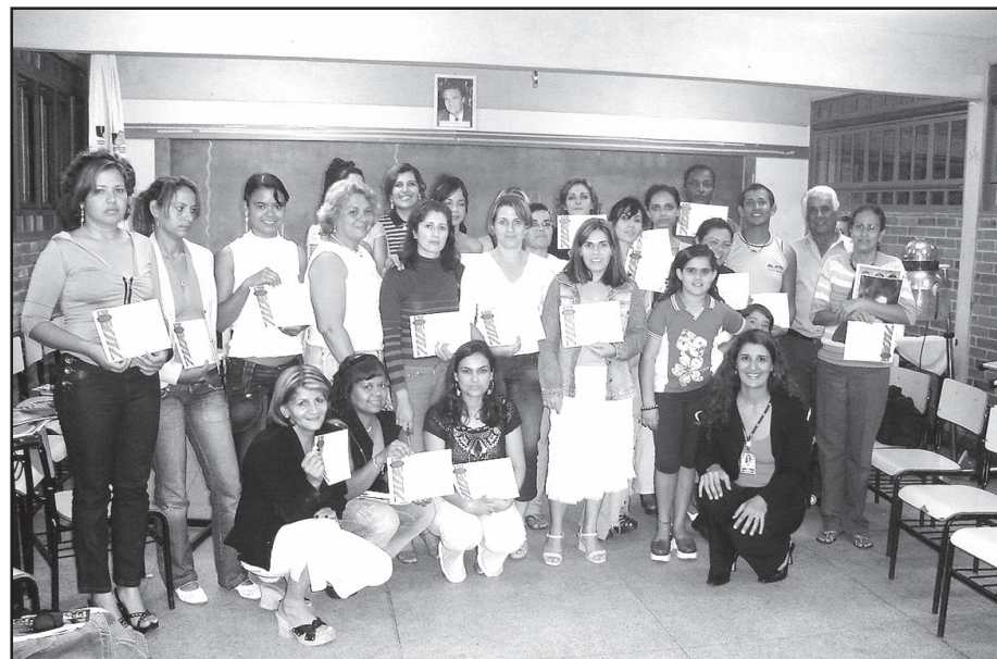
Cabeleireiras silvanienses investem em capacitação.

A Associação Comercial de Silvânia está satisfeita com os avanços conquistados, e com