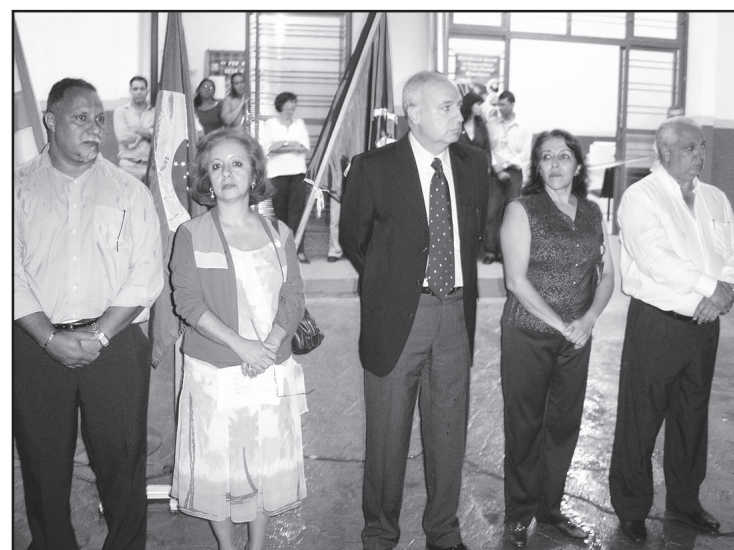
Autoridades presentes à inauguração do PrevCidade.