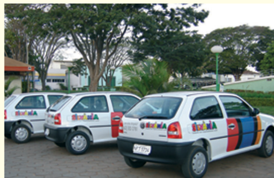
A aquisição de novos carros é mais segurança e a manutenção dos veículos e máquinas, ao lado da manutenção de estradas é um dos serviços que mais toma tempo e recursos da administração municipal.