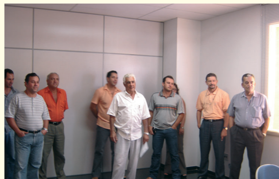
A reforma do piso superior do prédio da Prefeitura foi importante obra que trouxe conforto e funcionalidade para Secretarias.