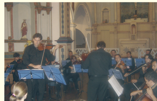
Concerto com a Orquestra de Câmara Goyazes.