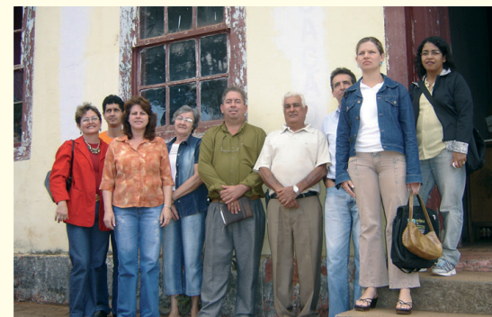
O Conselho de Cultura foi reestruturado.