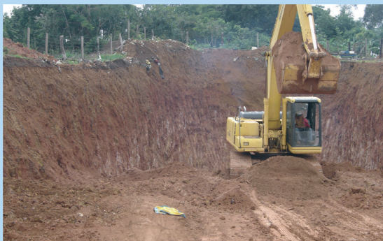
A construção do aterro sanitário.

Participativa, realização do Ibama em parceria com a prefeitura; de Educação Ambiental, em parceria com a empresa Walm Engenharia/Corumbá IV.