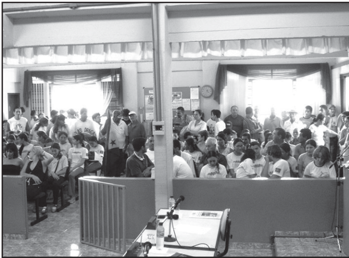
Cresceu a participação popular nas sessões: cidadania.

Apesar de um ano legislativo ter uma “área útil” menor que o ano do calendário comum, a Câmara Municipal de Silvânia encerrou as atividades de 2005 com notável saldo produtivo. Fator que chamou a atenção foi a participação popular, cujo crescimento tem marcado de forma positiva os últimos anos da atividade legislativa em Silvânia.