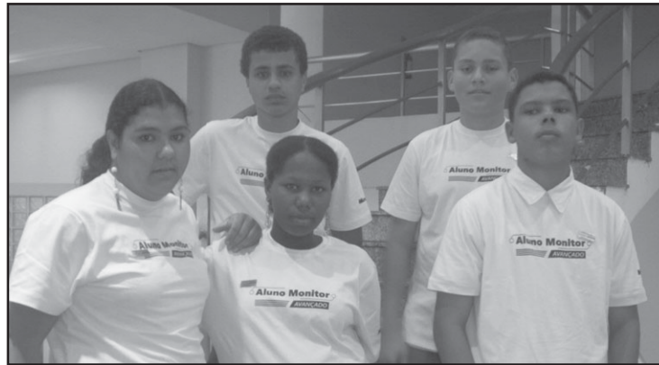
Alunos do Dom Emanuel na cerimônia de entrega de certificados.

Na Escola Dom Emanuel eles foram orientados pela