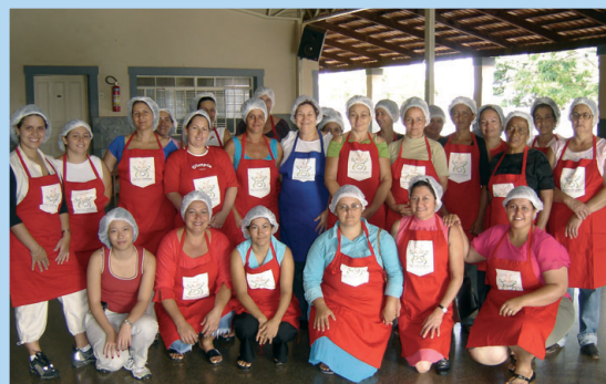
Curso para merendeiras das escolas municipais: parceria com a Unilever trouxe benefícios para nossas crianças e adolescentes.