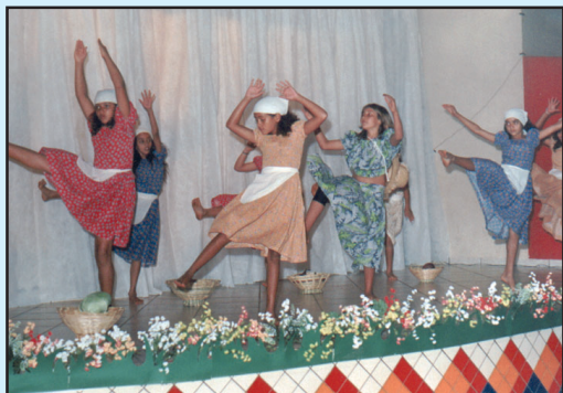
Talento e criatividade nas apresentações.

A AABB foi totalmente transformada em um ambiente educativo, onde os diversos talentos mirins, junto aos seus educadores, deram “shows” de conhecimento, arte, cultura e entretenimento.