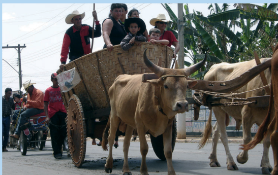
Desfile da Pecuária - festa já é tradição.

→ Realização de 15 cursos que capacitaram 319 pessoas nas mais diferentes áreas.