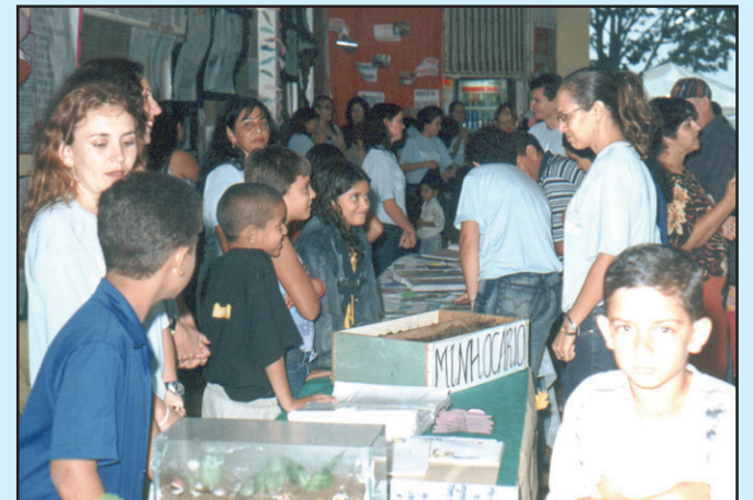
Muita gente prestigiou a Mostra, e gostou do que viu.