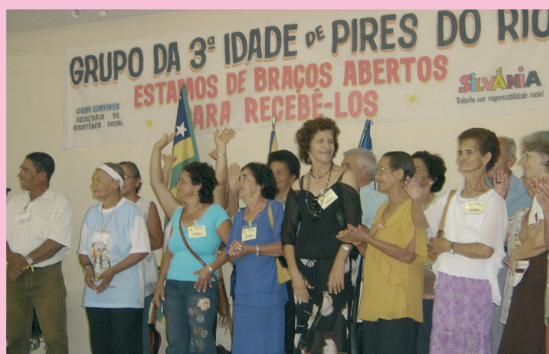
Confraternização com idosos de Pires do Rio.