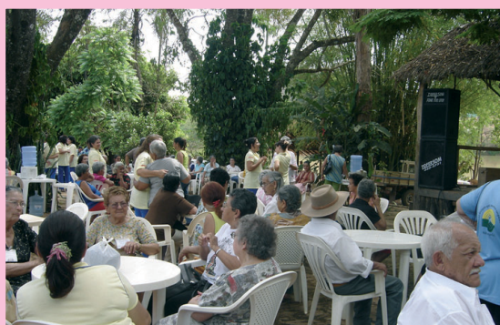
Os idosos tiveram tratamento especial.