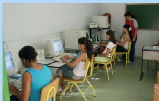
A Secretaria de Educação possui uma escola de informática que funciona no CESSI.