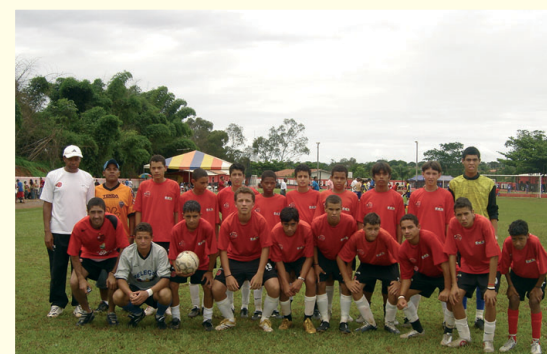
Escolinha de Futebol do Flamengo: apesar dos poucos meses de funcionamento, primeiros frutos já são colhidos