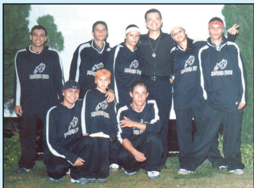
Grupo de dança