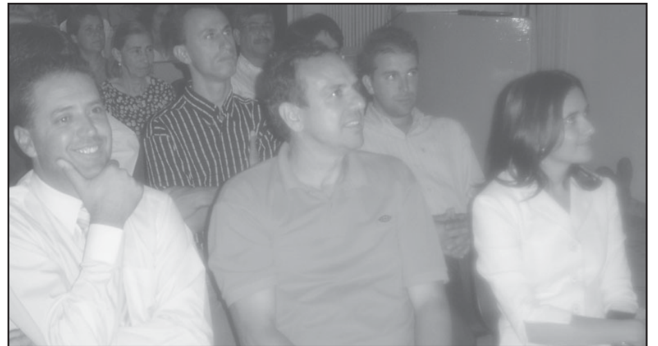
A Câmara homenageou os ex-vereadores de Silvânia.

Outra forma de reconhecimento que a Câmara se empenhou em realizar em 2005 foi a entrega solene de títulos de Cidadão Silvaniense a