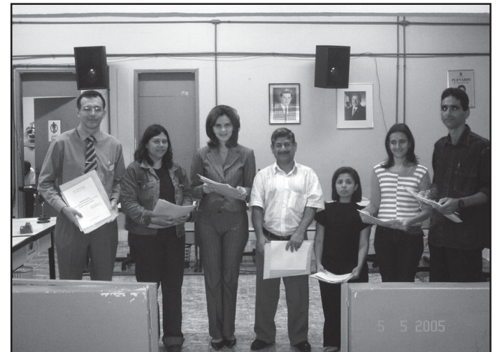
Projetos como o Infância Protegida tiveram o apoio da Câmara.

executivas e parlamentares. Em 2006, espera-se que continue a crescer a participação da comunidade tanto nas