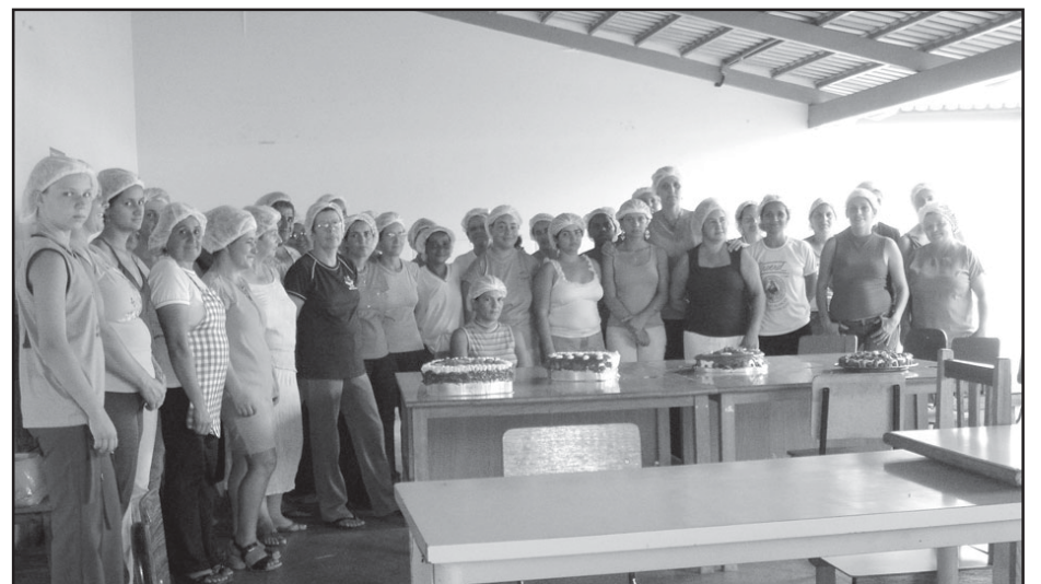
Uma inovação da atual legislatura foi o oferecimento de cursos à comunidade.

sessões ordinárias quanto nas demais atividades discussões promovidas pela Câmara, afinal, cidadania se constrói com participação.