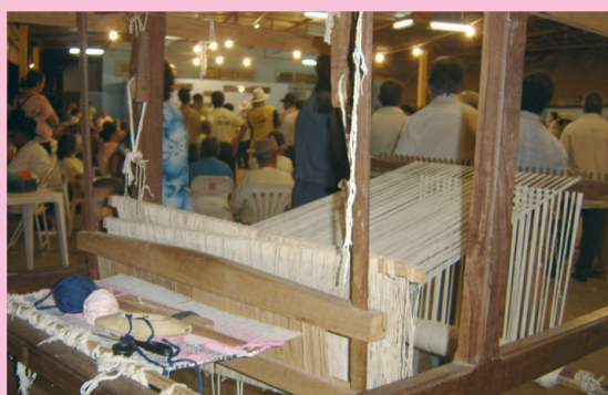
A produção permanente de artesanato.