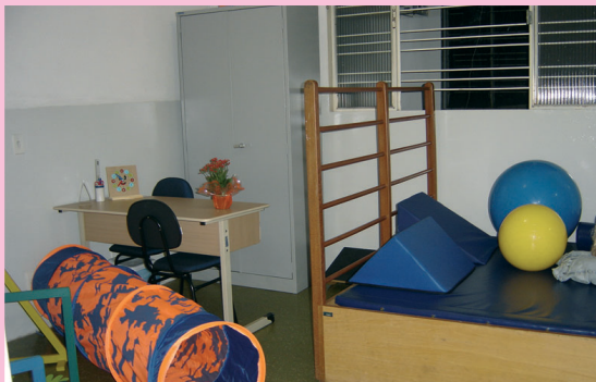
SICRER (acima), PSF do M a de Lourdes e SAMU: investimentos em qualidade de vida.