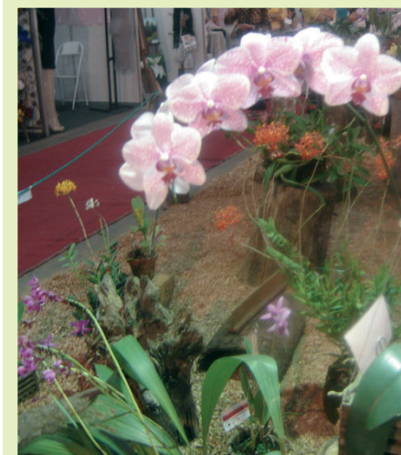
A I Exposição de Orquídeas e de Artesanato de Silvânia foi um sucesso. A festa deve virar tradição.

→ Participação na Frente Empresarial para aprovação da Lei Geral de Micro e Pequenas Empresas.