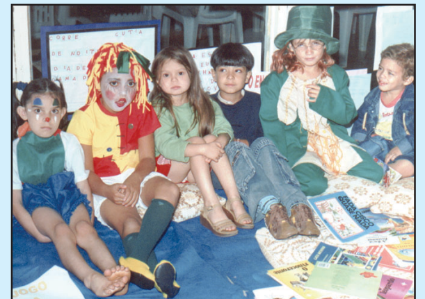
Crianças representando personagens infantis.