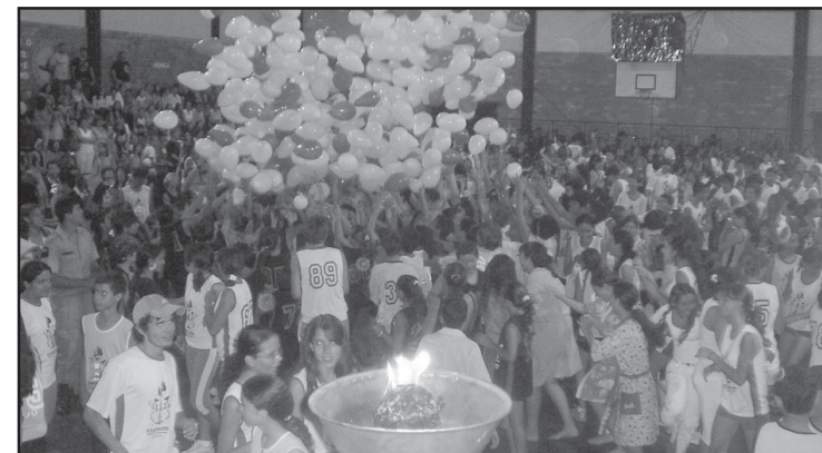
Olimpíadas: o evento mais esperado pelos alunos.

Fato criticado por pais de alunos foi o fato das camisetas, de uso obrigatório, terem tido seu preço inflacionado em mais de 100% em relação aos anos anteriores e também em relação ao mesmo evento promovido no primeiro semestre, só que para os alunos da primeira fase. Na ocasião as camisetas foram comercializadas a R$ 9,00, preço bem inferior aos praticados nos últimos jogos, R$ 19,00.