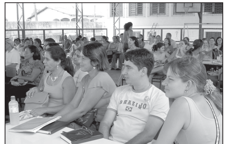
Cerca de 150 professores e funcionários participaram do evento.

O encontro foi encerrado com a visita do prefeito João Caixeta, que discursou aos presentes, e, logo após, com um coquetel.