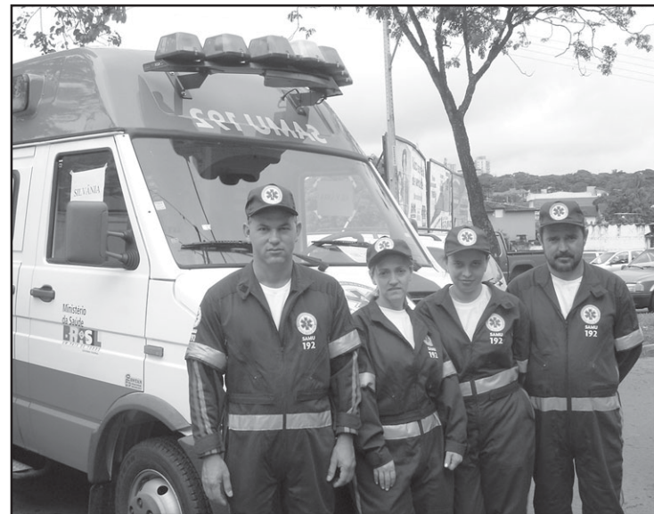
O Samu deve ser acionado apenas em situações de emergência.

e como e o que aconteceu. É bom seguir os conselhos do médico regulador que realizar o atendimento pelo telefone enquanto aguarda a chegada do socorro;